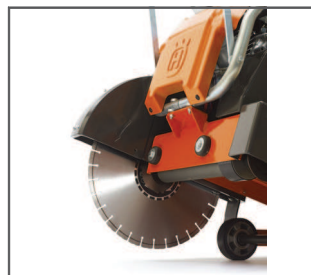
NISKI POZIOM DRGAŃ System montażu silnika i wału tarczy zwiększa wygodę i zapewnia znakomitą wydajność pracy.