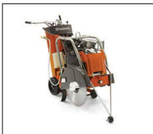
NAPĘD WŁASNY Łatwa i wygodna obsługa.

Nasza wygodna w obsłudze przecinarka jezdna FS 524 z silnikiem benzynowym ma dużą moc mimo niewielkiego rozmiaru oraz napęd własny, dzięki czemu znakomicie nadaje się do cięcia asfaltu i betonu. Odpowiednia do mniejszych i średniej wielkości robót drogowych i napraw nawierzchni, tnie na głębokość do 241 mm. Optymalne przenoszenie mocy sprawia, że maszyna ta doskonale nadaje się do trudniejszych zadań, mimo swojego niewielkiego rozmiaru. Prosta w obsłudze, skonstruowana z myślą o komforcie użytkownika.