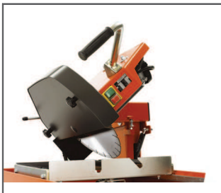
SOLIDNY I NIEZAWODNY SILNIK Duża trwałość użytkowa.

TS 350 E to skuteczna, uniwersalna przecinarka stolikowa o dużej wydajności cięcia wszystkich rodzajów cegły i bloków budowlanych. Może ciąć na głębokość 100 mm przy cięciu jednostronnym, a po obróceniu materiału osiąga głębokość cięcia 200 mm. Z łatwością tnie włąbnie lub pod kątem 45 stopni, co czyni ją bardzo wszechstronną. Solidna, lita rama z wbudowanymi przewodnikami zapewnia maszynie dużą sztywność i trwałość użytkową. Dzięki składanym nogom do obsługi maszyny wystarczy jedna osoba.