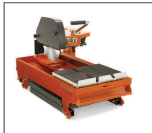
ŁATWY MONTAŻ I TRANSPORT Dzięki składanym nogom.