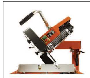
WSZECZSTRONNOŚĆ Tnie włąbnie lub pod kątem 45° albo 90°, co czyni ją bardzo wszechstronną.